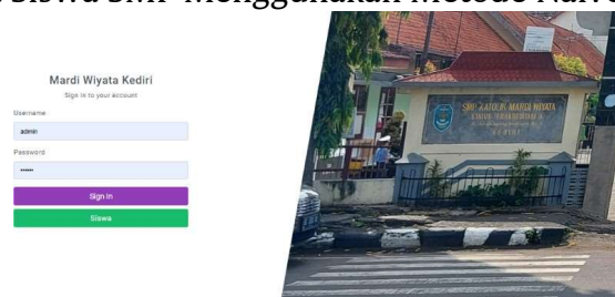
Gambar 2 Tampilan Login

Gambar 1 menjelaskan proses bisnis atau alur kerja Sistem Penentuan Kelas Unggulan Pada Siswa SMP Menggunakan Metode Naïve Bayes.