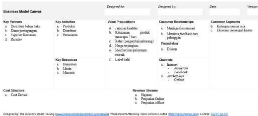
Gambar 1. Analisis Business Canvas

Gambar-gambar harus dijamin dapat tercetak dengan jelas (ukuran font, resolusi dan ukuran garis harus yakin tercetak jelas). Gambar dan tabel dan diagram/skema sebaiknya diletakkan sesuai kolom diantara kelompok teks atau jika terlalu besar diletakkan di bagian tengah halaman. Tabel tidak boleh mengandung garis-garis vertikal, sedangkan garis-garis horisontal diperbolehkan tetapi hanya yang penting-penting saja.